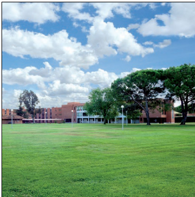
UCJC CAMPUS VILLAFRANCA