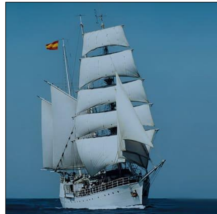
UCJC CAMPUS GOLETA CERVANTES SAAVEDRA